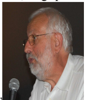
Pierre Garnier Président de la Fédération Nationale

De l'autre, le projet Centre Social est une idée pertinente qui intéresse les porteurs de politiques publiques car en effet, le besoin de lieux de proximité de vie sociale est reconnu, la question de la participation des habitants est omniprésente, les politiques publiques cherchent des formes de (re)territorialisation de leurs actions.